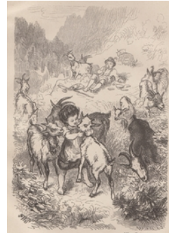
02 Friedrich Wilhelm Pfeiffer, Heidi's Lehr- und Wanderjahre, Illustration Heidi und die Geißen, 1880, Heidi-Archiv, Heidiseum