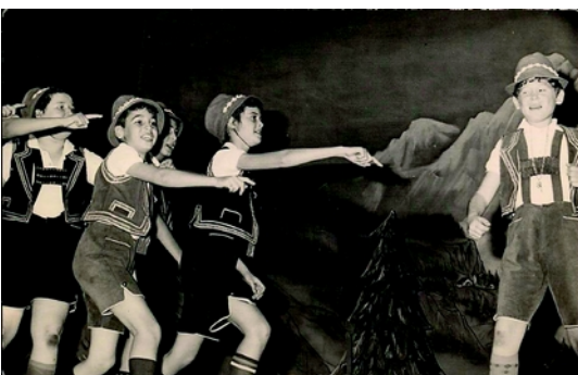
11 Die Ziegenhirten und Heidi, Heidi, Das Theater von Oz, 1969, Tif'eret Theater, Rishon LeZion, Israel, August 1969