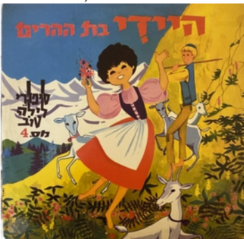
08 Album-Cover der erste israelischen „Heidi“-Schallplatte von 1963 der Reihe „Gute Nachtgeschichten“, Produktion: Studio 1, Heidi-Archiv, Heidiseum