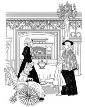
07 Illustration von Batia Kolton, Heidi in Frankfurt, 2020, Okyanus Publishing, Asaf Baraket