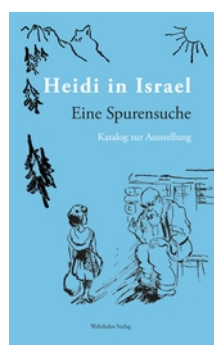
12 Katalogcover „Heidi in Israel. Eine Spurensuche“, Wehrhahn Verlag, 2021