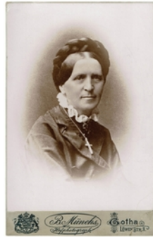
01 Portraitaufnahme Johanna Spyri, ca. 1880