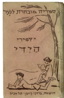
05 Heidi“-Ausgabe von 1955/56, Verlag Mordecai Newman