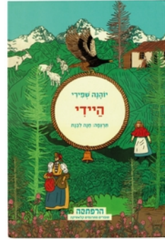
06 Umschlag der „Heidi“-Ausgabe von 2020, erste vollständige Übersetzung der beiden Heidi-Bände von Hanna Livnat, Illustration: Batia Kolton, Okyanus Publishing, Asaf Baraket