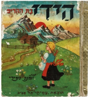
00 Umschlag der „Heidi“-Ausgabe von 1957/58, Johanna Spyri: Heidi Bat HeHarim [Heidi, Tochter der Berge], Illustration: Arie Moskowitzsch, Tel Aviv, Verlag Amichai, 1957/58

Pressefotos | Press Images Das Bildmaterial ist im Rahmen der Berichterstattung über die Ausstellung kostenfrei zu verwenden. Redaktionen können die Daten im Pressebereich herunterladen: www.juedisches-museum-muenchen.de/presse Bitte beachten Sie die jeweils angegebenen Rechteinhaber