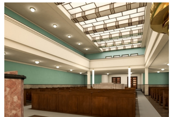
04 Synagoge in der Reichenbachstraße 27, Simulation: Arbeitsgemeinschaft HILMER & SATTLER und ALBRECHT Gesellschaft von Architekten mbH, SCHINDHELM Moser Architekten GbR