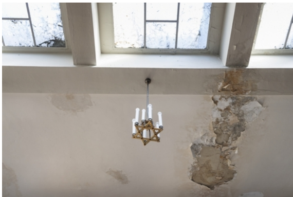
03 Synagoge in der Reichenbachstraße 27, Foto: Thomas Dashuber - Fotografie Film, 2021