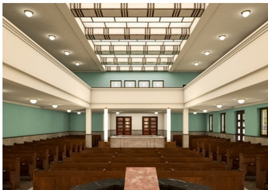
05 Synagoge in der Reichenbachstraße 27, Simulation: Arbeitsgemeinschaft HILMER & SATTLER und ALBRECHT Gesellschaft von Architekten mbH, SCHINDHELM Moser Architekten GbR