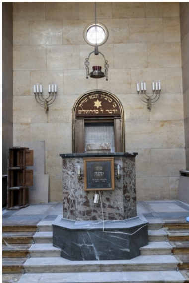
01 Synagoge in der Reichenbachstraße 27, 2021

Dauer der Installation | Duration of the installation : Ab 13.10.2021 | From October 13, 2021