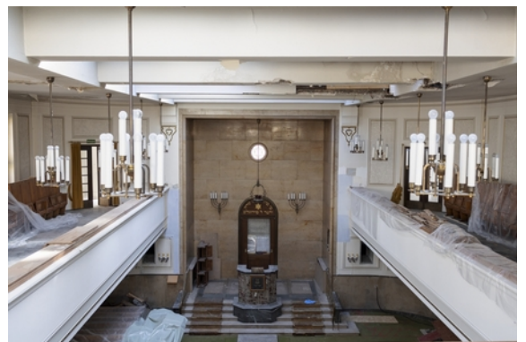
02 Synagoge in der Reichenbachstraße 27